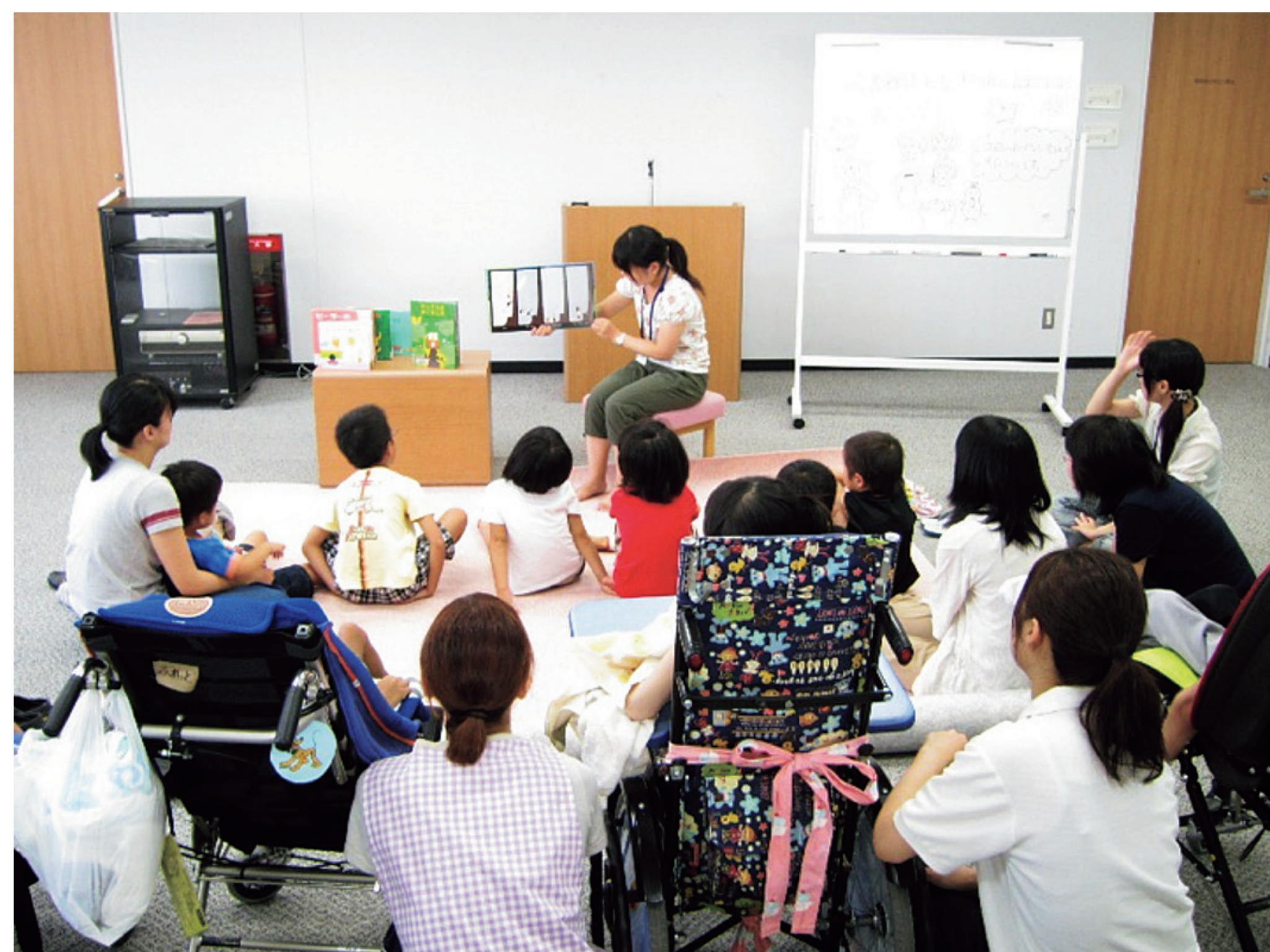
おはなしの会の様子

FLCとはFuture Librarians Club(未来の図書館員の集い)のことです。部員は19名、読書や附属図書館の利用促進を目的に結成されました。上田情報ライブラリーにおける読み聞かせ活動(「図書館員と図書館員のたまごたちのおはなし会」)、附属図書館でのお手伝いなど多彩な活動を展開しています。