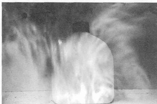
「ものたちへのレクイエム3」ピンホール 制作：2010年3月