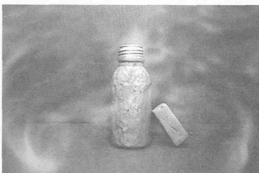
「ものたちへのレクイエム4」ピンホール 制作：2010年3月